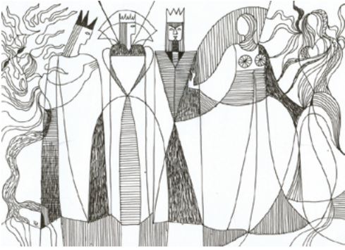
Bartók: Der holzgeschnittzte Prinz Éva Rab-Kováts